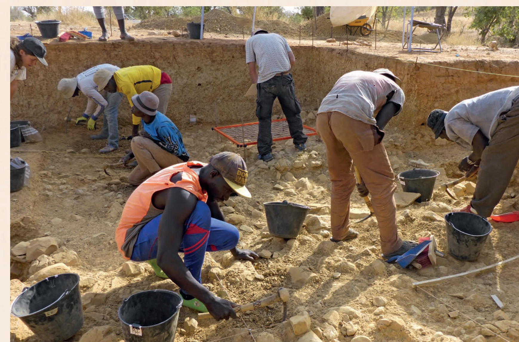
Figure 2 Ambiance de fouille au Ravin Blanc IV.

(contre 1497 éclats non retouchés), dont certains sont restés sous la forme d'ébauches ou ont été cassés à la taille et abandonnés sur place. La cohérence des séquences de taille suggère que nous sommes en présence d'un grand atelier de taille issu d'une occupation ponctuelle , plutôt que d'une succession d'occupations sur un temps plus long (fig. 3).