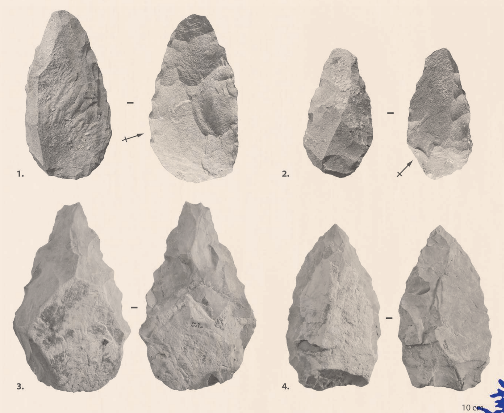
Figure 5 Bifaces du site du Chacal. Les flèches indiquent le sens de débitage des éclats-supports, qui sont en l'occurrence de grands éclats latéraux (méthode Victoria West) ensuite façonnés en bifaces. Référence: Mayor et al., 2022.

Ces deux sites parfaitement conservés in situ sont extrêmement précieux pour documenter l'Acheuléen ouest-africain. Afin de les dater, des prélèvements pour datation par luminescence stimulée optiquement (OSL) ont été réalisés. Mais la nature des sites et du sédiment prélevé a été à l'origine de plusieurs problèmes lors du traitement de ces échantillons, qui n'ont malheureusement pas encore pu être datés. Lors des dernières campagnes, de nouveaux prélèvements ont été réalisés, ainsi que des échantillons pour tester une nouvelle méthode de datation: la résonance paramagnétique électronique (ESR). Ces divers prélèvements sont en cours de traitement et les dates qu'ils fourniront permettront d'établir des références importantes pour l'Early Stone Age ouest-africain .