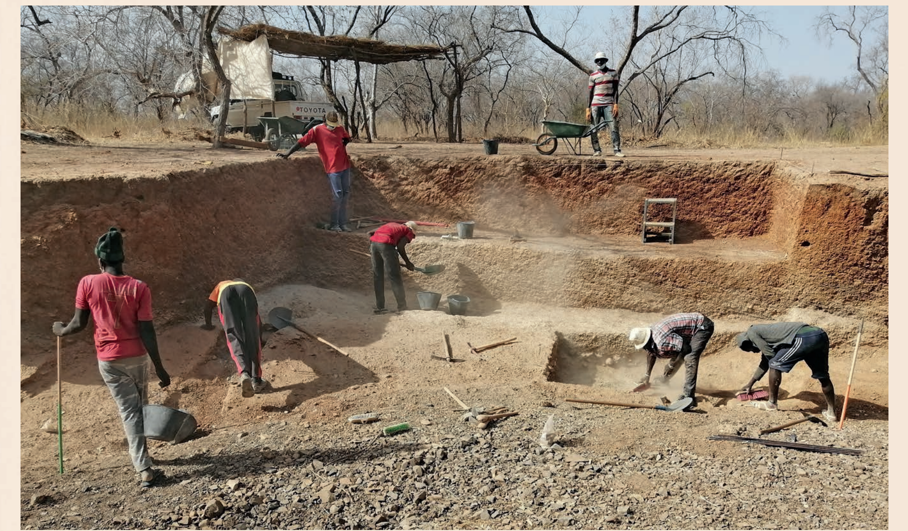
Figure 4 Site du Chacal en cours de fouille.

Le site du Chacal (fig. 4), découvert en 2019, semble quant à lui avoir eu une fonction bien différente. En effet, l'unité sédimentaire 1a qui contient l'industrie acheuléenne consiste en un grand dépôt de nombreux outils finis (n=127), tandis que les artefacts témoignant d'étapes de taille ou de façonnage, comme des éclats et des nucléus à éclats, sont présents mais bien moins nombreux. L'outillage du Chacal nous renseigne malgré tout sur les chaînes opératoires employées lors du façonnage: bifaces, unifaces, hachereaux, bifaces-hachereaux, dont certains sont façonnés sur des éclats obtenus latéralement (méthode de débitage Victoria West), raclours, rabots... (fig. 5).