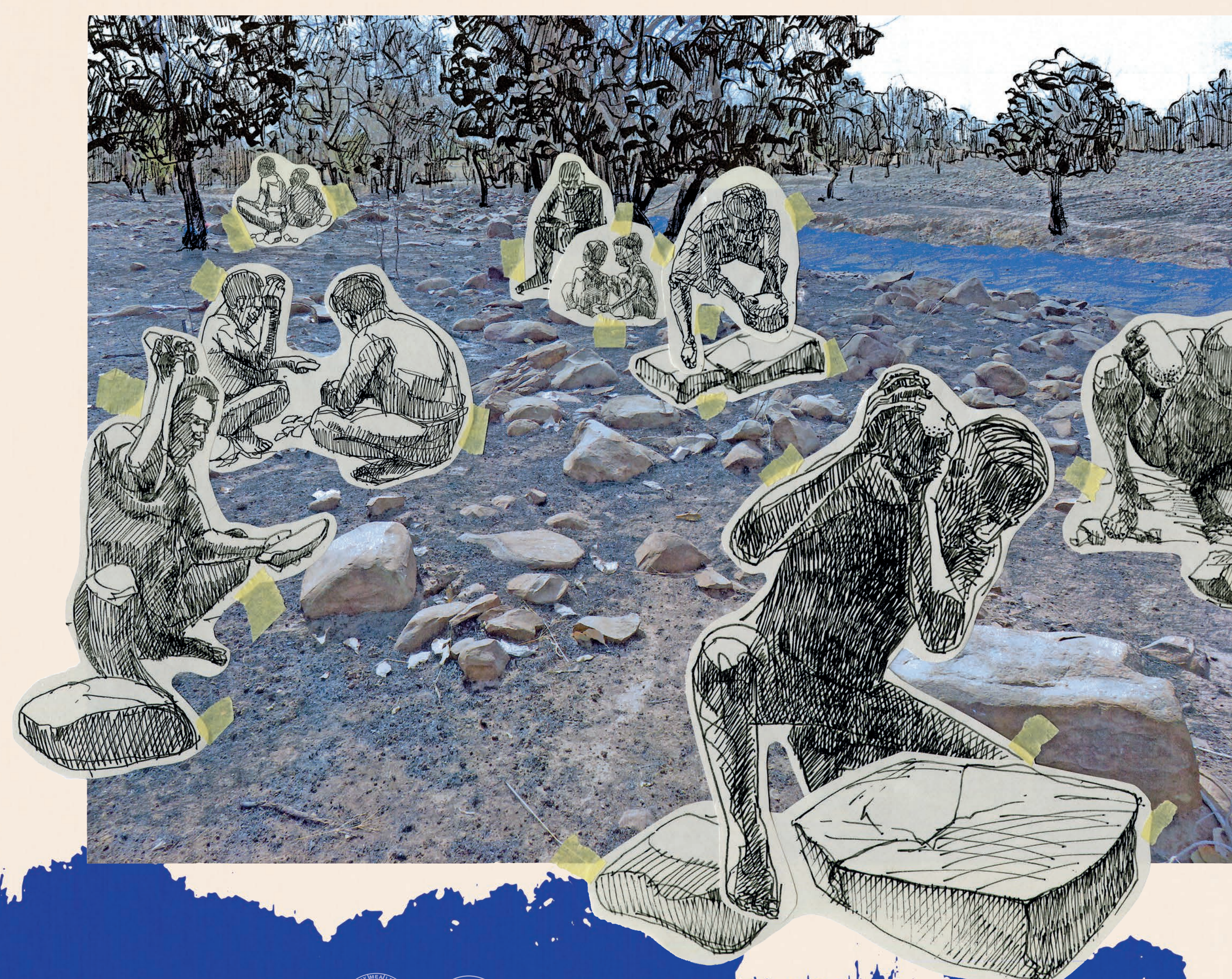
Figure 3 Reconstitution des tailleurs de pierre acheuléens du site du Ravin Blanc IV. Dessin et conception: E. Gutscher, K. Douze.